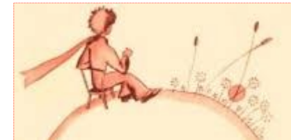
Ilustración de El principito (A. de Saint-Exupéry)

SAINT-EXUPÉRY, Antoine de. El principito . Barcelona: Salamandra, 2001 [ver más información en Wikipedia o Entrelectores ]